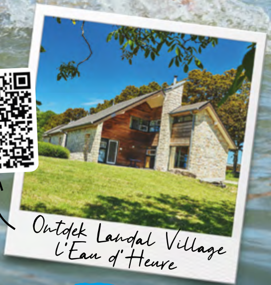
Outdek Landal Village L'Eau d'Heure