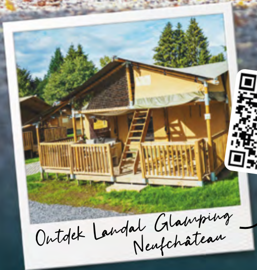
Outdek Landal Glamping Neufchâteau